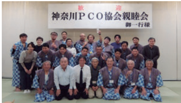
親睦会集合写真 (写真は64頁に再掲)

事業には、神奈川県有害生物防除協同組合(防虫協)、東京都・群馬県・埼玉県・千葉県のPCO協会、関東しろあり対策協会など県内外の友好団体からの参加もいただき、ゴルフコンペには20人、親睦会には27人の参加を得て盛大に実施しました。