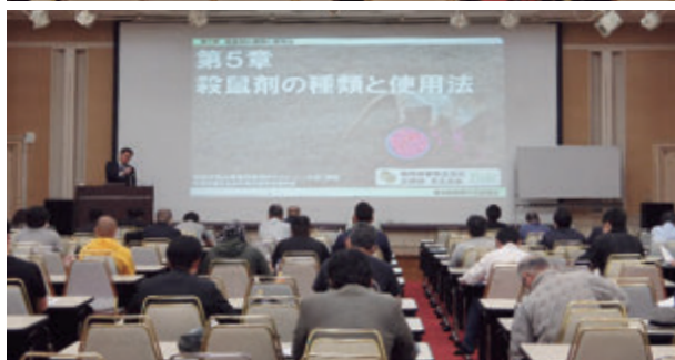
防除作業従事者研修会風景