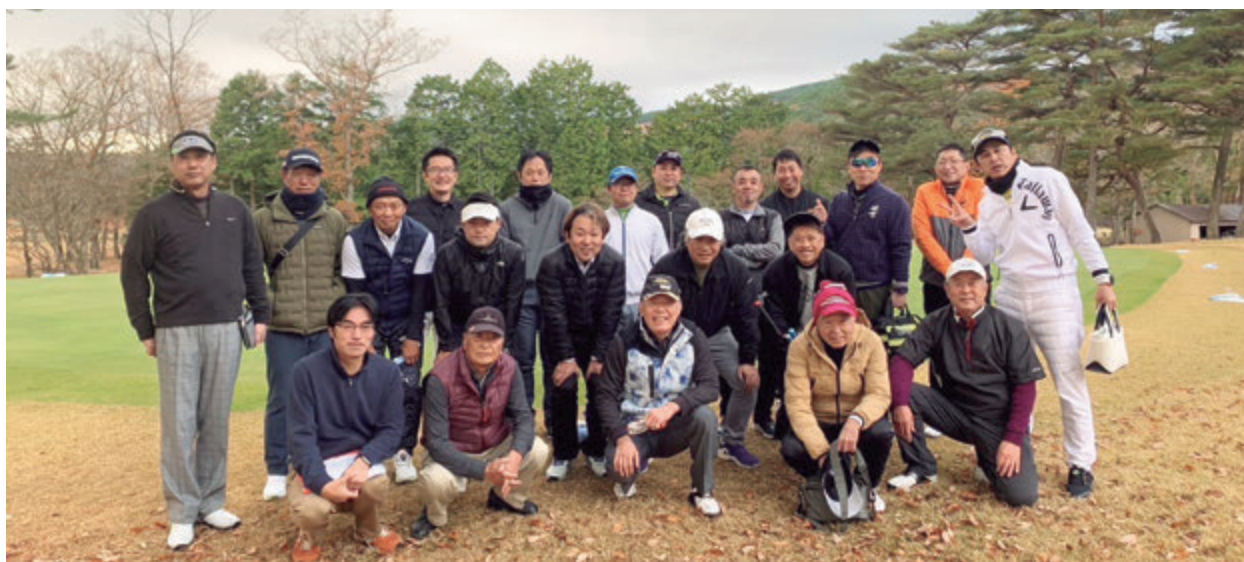
令和5年度福利厚生活動(神べ杯ゴルフコンペ) 富士小山ゴルフクラブでの記念写真