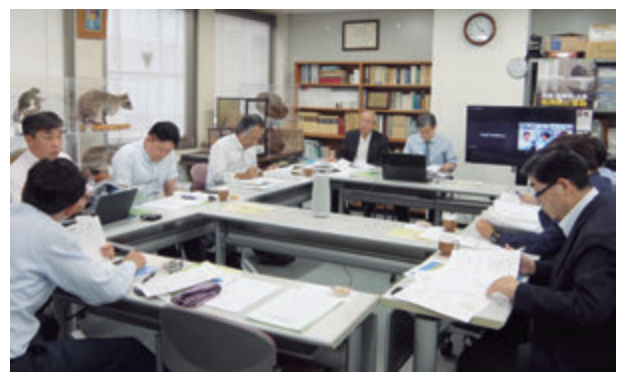
企画広報委員会風景