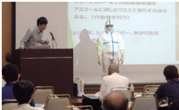
感染症特別講習会(ガウンテクニック)風景