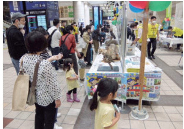
害獣の剥製に興味深く見る来場者 (詳細は44頁～46頁参照)

大防止の観点から中止し、令和3年度・4年度は、ソーシャルディスタンスを確保し、集客力の強い剥製・標本を展示せず、規模を縮小した形で実施しましたが、令和5年度はコロナ禍後の4年ぶりの通常開催となり、来場者は4,693名(去年は3,024名)にのぼりました。