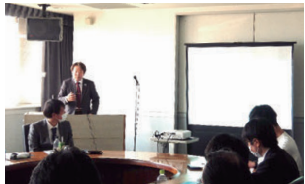
ペストコントロール技術セミナー風景