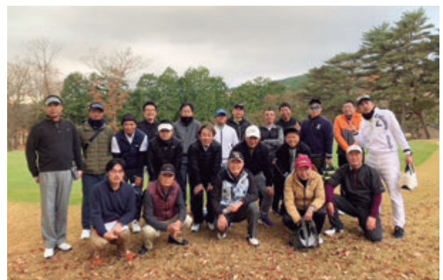
令和5年度福利厚生活動 (神ペ杯ゴルフコンペ)(写真は64頁に再掲)

今年も昨年同様ゴルフコンペと宿泊による親睦会の2本立てで、ゴルフコンペは、静岡県駿東郡小山町の「富士小山ゴルフクラブ」で、また親睦会は湯河原温泉の「ニューウェルシティー湯河原」で開催しました。