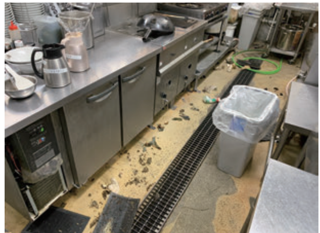
厨房機器下の掻き出し後の写真②