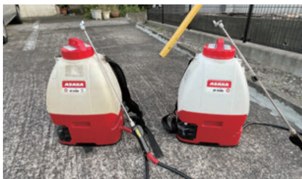
同じく牛田噴霧器 牛田社長が開発されたバッテリー動噴防除機材 ゴキブリ防除でもチョウバエ防除でも有効的に力を発揮してくれます