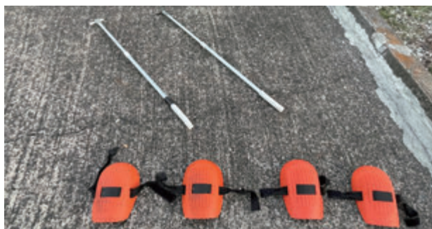
上：掻き出し棒、下：膝パット 私の相棒です