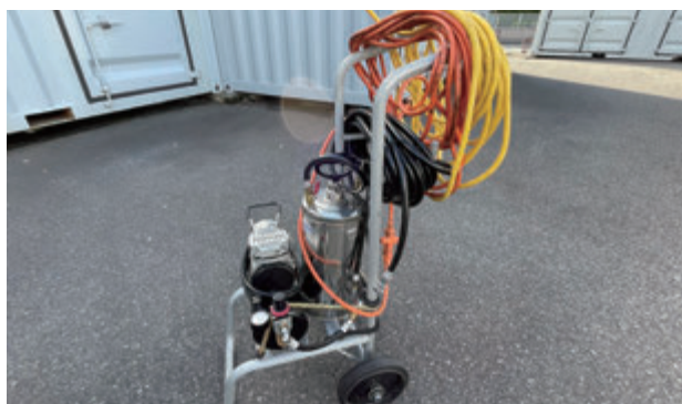
牛田噴霧器 牛田社長が開発された泡噴霧防除機材