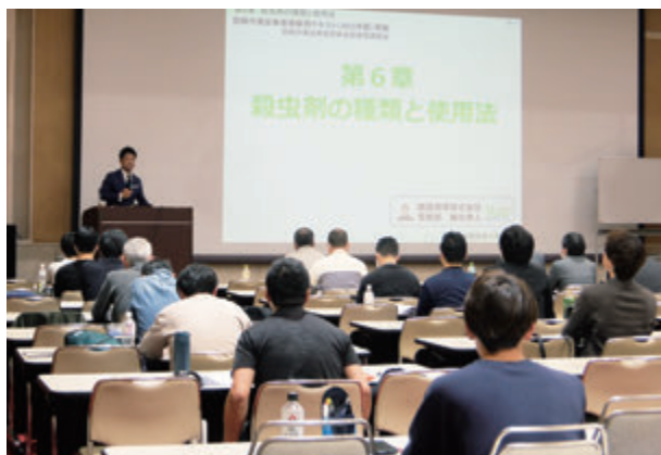
防除作業従事者研修会風景