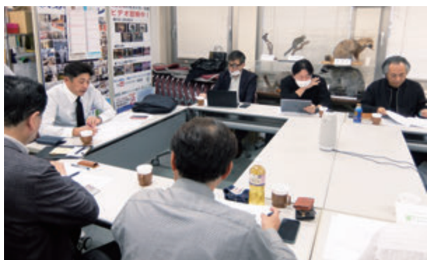
企画広報委員会風景