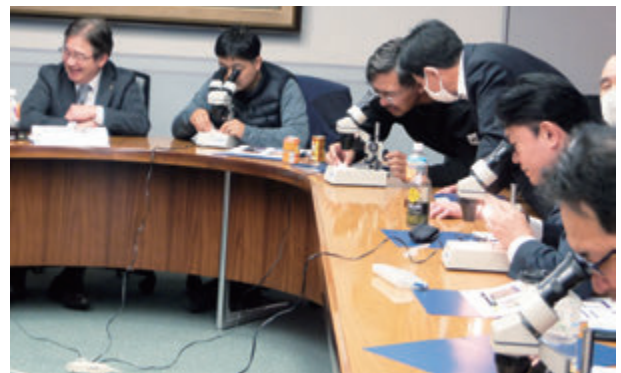
顕微鏡を使って同定を行う受講生