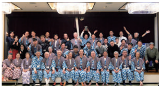
(親睦会集合写真) (写真は68頁に再掲)