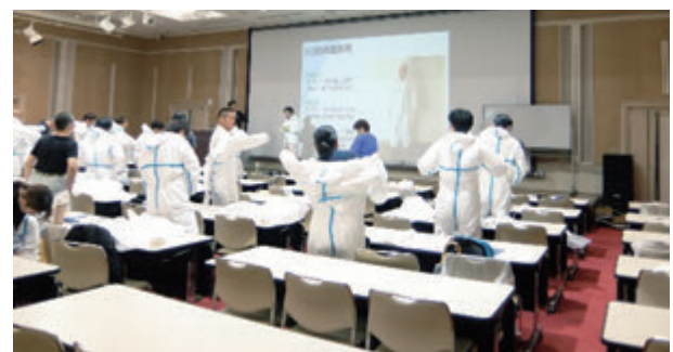
感染症特別講習会(ガウンテクニック)風景

感染症特別講習会は令和7年6月10日に、神奈川県立かながわ労働プラザにおいて実施されました。