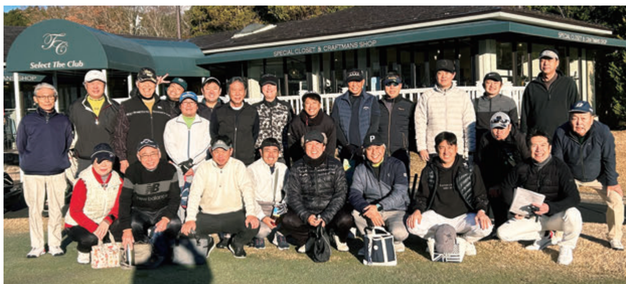
神へ杯ゴルフコンペ (「太平洋クラブ御殿場WEST」での記念写真)