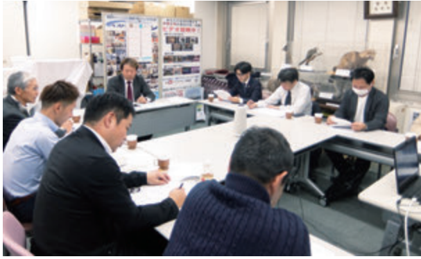
技術教育委員会風景