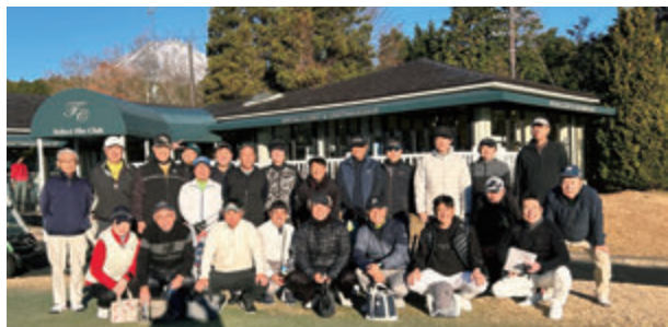
令和7年度福利厚生活動 (神ペ杯ゴルフコンペ) (写真は68頁に再掲)

親睦会は、日中のゴルフ参加者も加わり、午後6時30分から宴会場「天照の間」にて盛大に行われました。